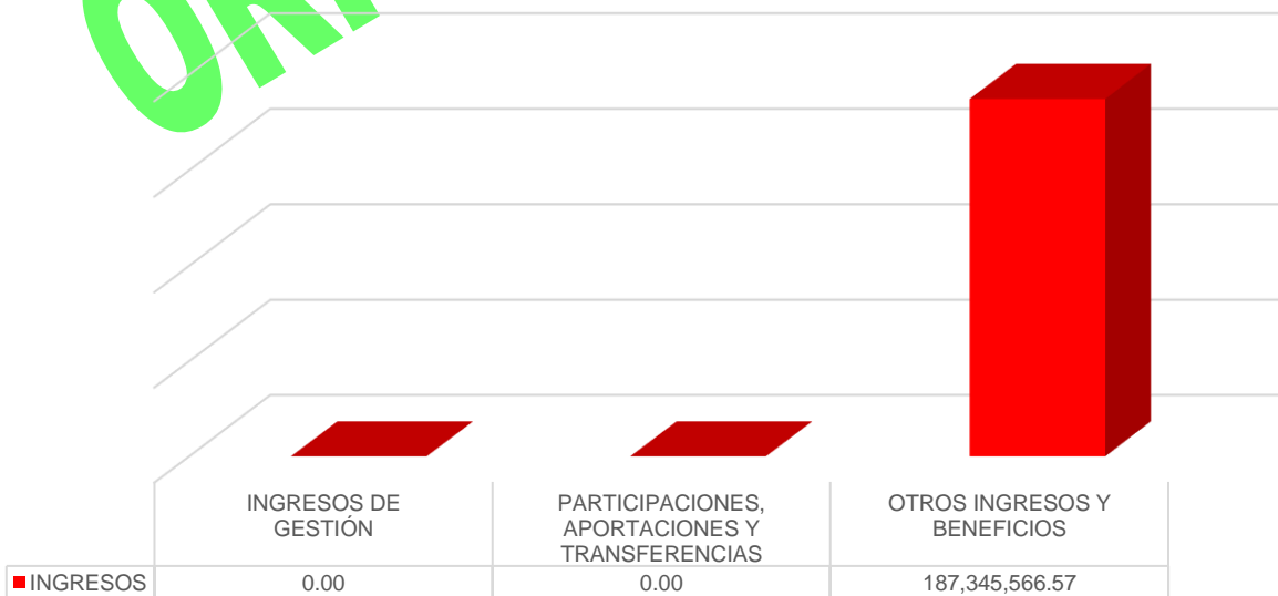
Gráfico 1. Ingresos